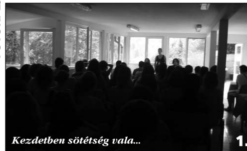
Kezdetben sötétség vala...