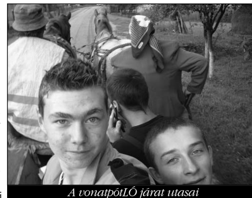
A vonatpótló járat utasai

mert nem mindenkinek szólt oda a helyjegye, ahol ültek. Így végül a brassóiak közül négyen a 9. vagonban utaztak, az udvarhelyiek pedig a nyolcasban.