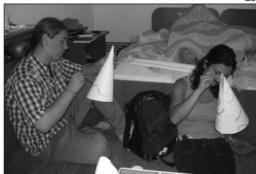
Készülôben a Dökopoly :)