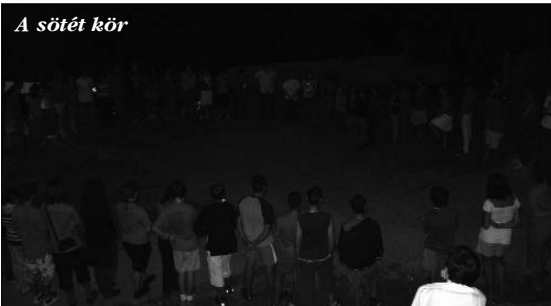
A sötét kör

Amiután bevonult a Ku-Klux-Klanra emlékeztető, kör alakban felálló , többnyire vörös pólós – talán kommunista? – tömeg, rögtön az elején a horrorfilmekből ismert fényeffektus adott hátborzongató jelleget a szertartásnak. A lámpa